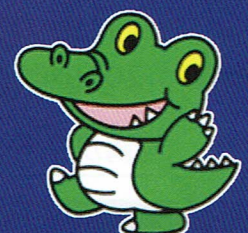
大阪大学公式マスコット 「ワニ博士」