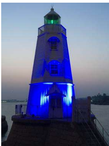
旧堺燈台、(主催堺市)