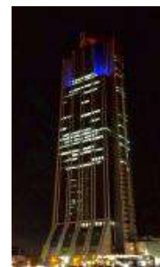
大阪府咲洲庁舎 (大阪市住之江区)