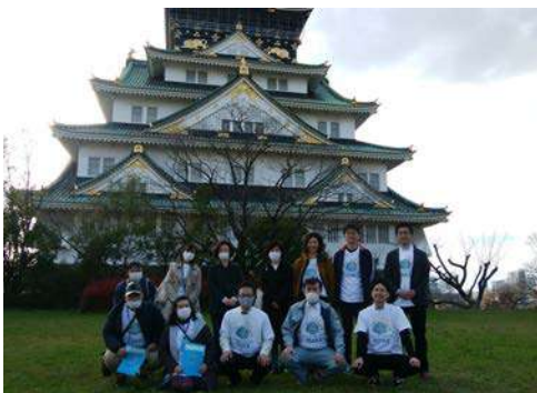
シート貼り付けのみなさま

地域のケーブルテレビ「世界自閉症啓発デー」について電話インタビューで啓発活動をしました。