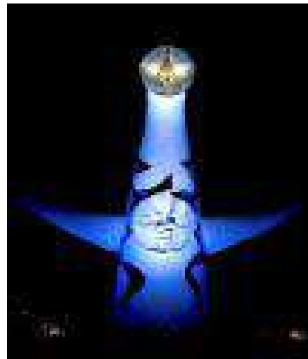
万博記念公園太陽の塔(吹田市)