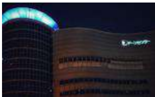
大阪府立男女共同参画・青少年センター（ドーンセンター）(大阪市中央区)