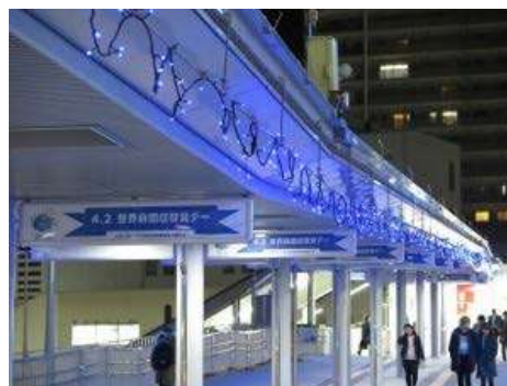
JR 高槻ロータリー前

※天保山大観覧車は新型コロナウイルス感染症の影響により臨時休業となったため、中止となりました。