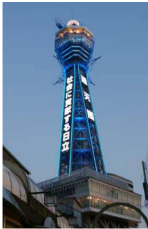
通天閣 (大阪市浪速区)