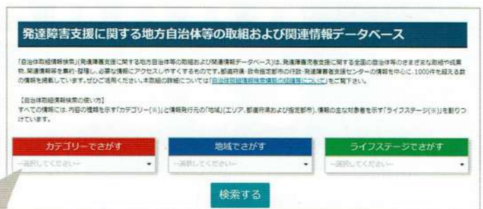
▲「自治体取組情報検索」の情報検索画面